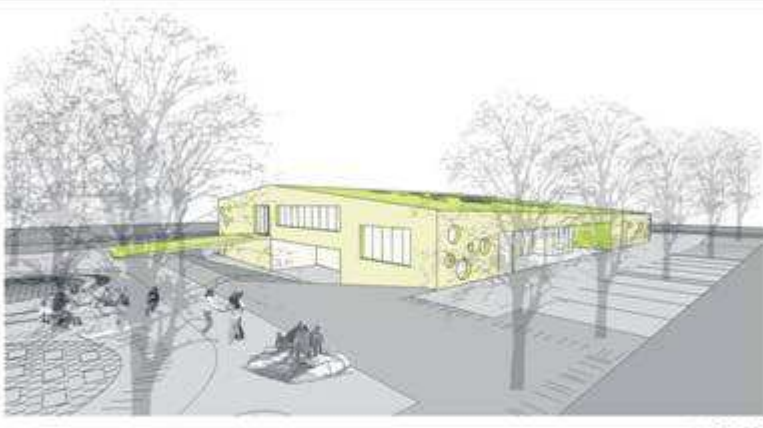
presjek 1 1/200